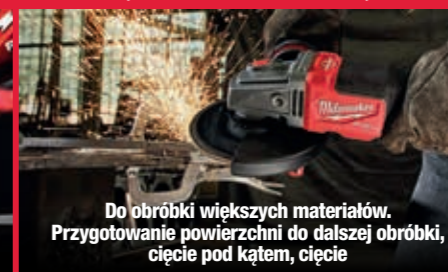
Do obróbki większych materiałów. Przygotowanie powierzchni do dalszej obróbki, cięcie pod kątem, cięcie