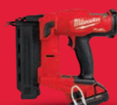
M18 FUEL GWOŹDZIARKA WYKOŃCZENIOWA 4933471407