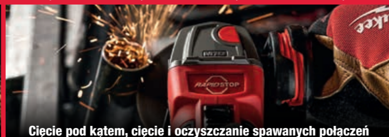
Cięcie pod kątem, cięcie i oczyszczanie spawanych połączeń