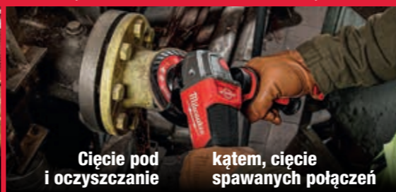
Cięcie pod kątem, cięcie i oczyszczanie