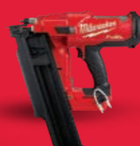
M18 FUEL GWOŹDZIARKA 21° 4933478993