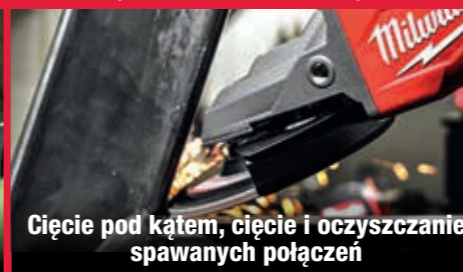
Cięcie pod kątem, cięcie i oczyszczanie spawanych połączeń