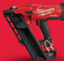
M18 FUEL GWOŹDZIARKA 34° 4933471404