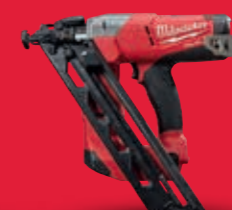
M18 FUEL GWOŹDZIARKA WYKOŃCZENIOWA NA GWOŹDZIE KĄTOWE 4933459633