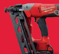
M18 FUEL GWOŹDZIARKA WYKOŃCZENIOWA NA GWOŹDZIE KĄTOWE 4933451570